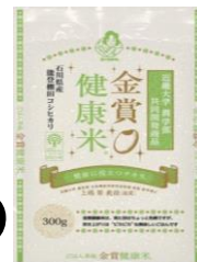
石川県産産能登棚田コシヒカリ 300g