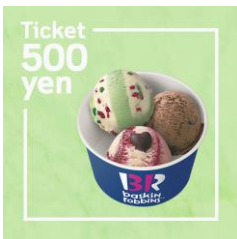
サーティワン アイスクリーム 500円ギフト券