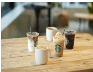
スターバックス ドリンクチケット 500円分